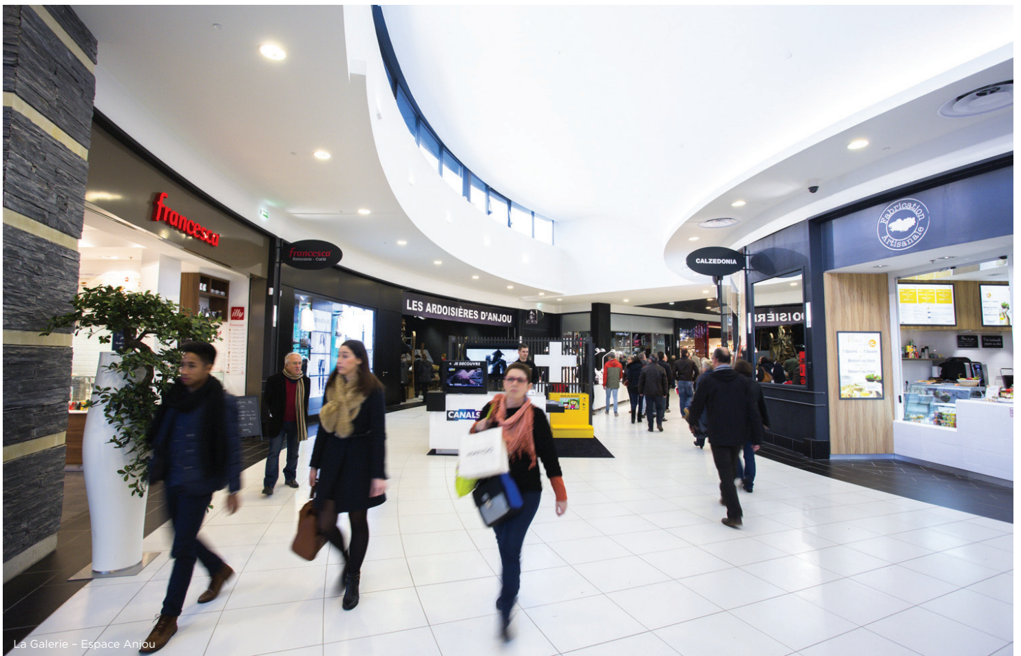
La Galerie - Espace Anjou