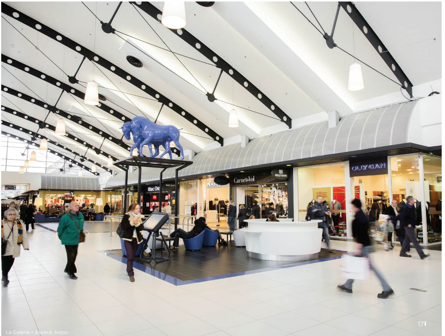
La Galerie - Espace Anjou